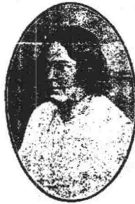
কাজী নজরুল ইসলাম

শেটে ধসে তোর মুখের আগুন আগুন ধসিয়ে তোষে, মনে ধসে তোর কোমের আগুন বুক ধসে হুখে শোকে ।